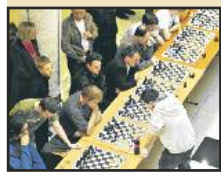
Succès pour les parties d'échecs